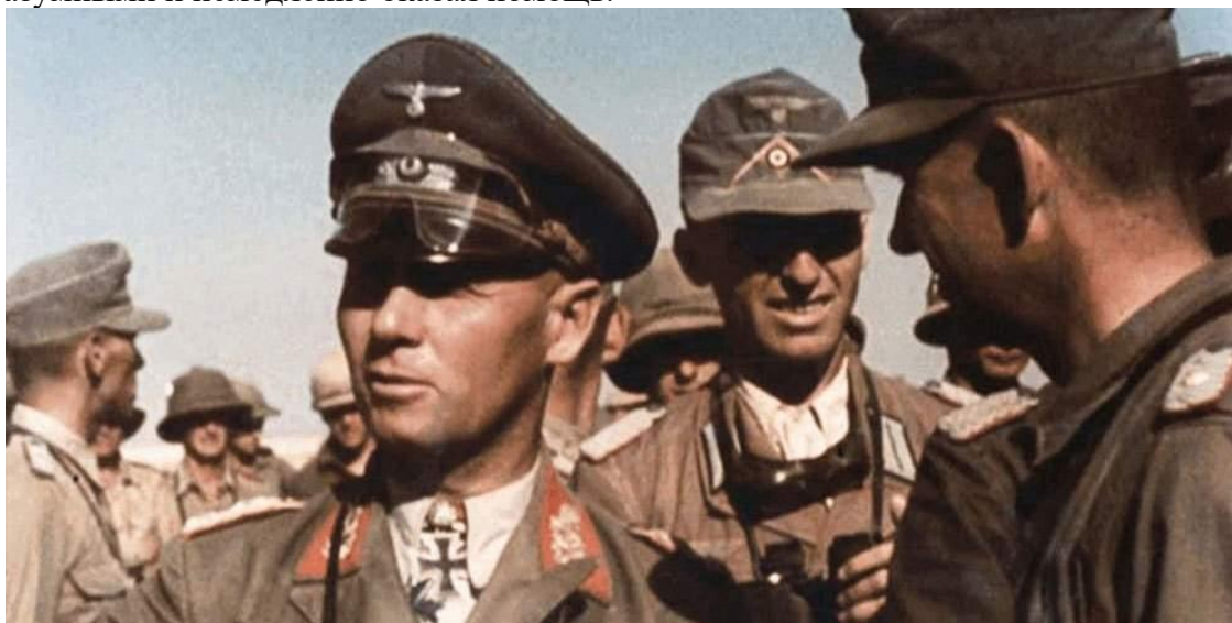
Генерал-лейтенант Эрвин Роммель в Ливии, 1942 год

А потом англичане остановились: им еще нужно было отправить войска в Грецию. Пришла очередь итальянцев использовать сберегательное перемирие и воспользоваться опцией «позвонить другу». В отличие от балканских приключений Муссолини, Гитлер считал свои планы в Северной Африке вполне разумными и немедленно оказал помощь.