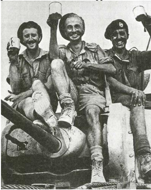
Британские танкисты после победы в Эль-Аламейне. 1942 г.

покинутые англичанами. 13 ноября он занял Тобрук, 20 — Бенгази. Решающий поворотный момент произошел в войне в Африке.