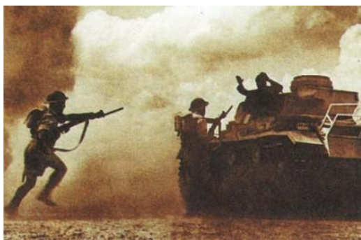
Захват итальянского танка в ливийской пустыне. 1941 г.