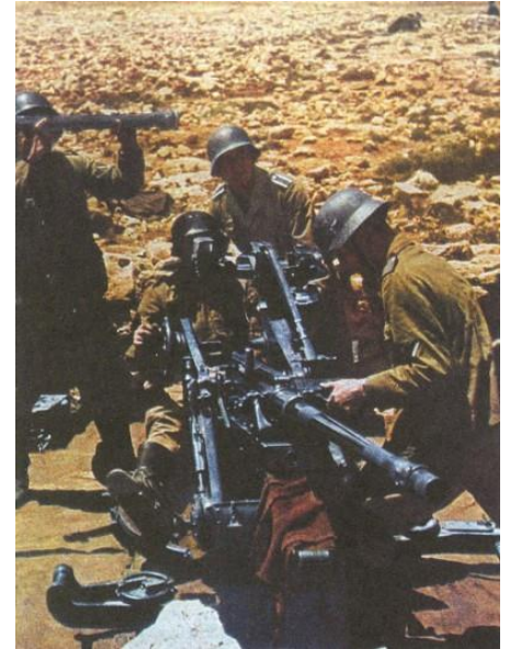
Немецкие зенитчики готовятся к отражению атаки британской авиации. 1941-1942 гг

Передвигаться по пустыне можно было только на автомобилях или бронетранспортерах. Эти особенности предопределили своеобразие театра военных действий в Северной Африке, его отличие от других, на которых проходили сражения Второй мировой войны. Здесь велись вооруженные бои небольших моторизованных отрядов, которые гнались друг за другом вдоль морского побережья и отдыхали между стычками (а также для снабжения себя водой) в оазисах-поселениях, расположенных за много километров. При этом местное (арабское) население практически не пострадало, так как представители обеих противоборствующих сторон относились к нему с презрением, в колониальном духе, понимая, что разорение некоторых поселений не соответствует их интересам.